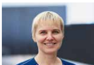
Vita Andrews Ledamot (VALD 2019/2 ÅR) Swedavia AB