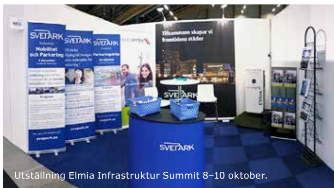
Utställning Elmia Infrastructur Summit 8-10 oktober.