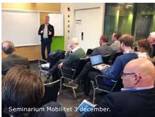
Seminarium Mobiliet 3 december.